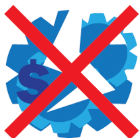
СТОИМОСТЬ НЕИСПРАВНОГО БЛОКА (АВИАКОМПАНИЯ)