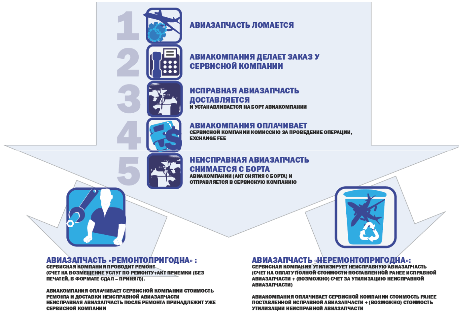
СХЕМА ОПЕРАЦИИ EXCHANGE В МИРЕ